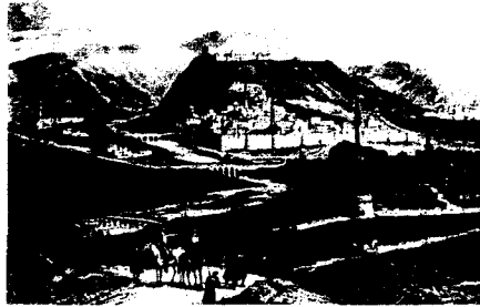
Kars, genel görünüm

Tanzimat sonrası batılılaşmaya uyum gösteremeyen yeniçeri ocaklarının kapatılmasından sonra güç kaybeden medrese ve tekke, âşık tarzı heceyle şiir örnekleri vermeye başlamıştır. 19. yüzyılda Batıya açılma Türk sosyo-kültürel yapısını belirleyen kurumları da etkiledi, değişime uğrattı. Matbaanın yaygınlaşması yazılı ortamın başlaması sözlü kültür ortamının ürünü olan âşıklık geleneğini de etkiledi. 2. Meşrutiyet'le birlikte basından sansürün kalkmasıyla birlikte gittikçe gelişen basın ve tiyatro kumpanyalarının faaliyetleri gibi yeni eğlence formları karşısında 19. yüzyılın sonlarına doğru ortaya çıkan semaî kahvehaneleri işlevlerini kaybederek birer birer kapanırlar. Semaî kahvehaneleri ve çalgılı kahvehaneler İstanbul'a özgü bir zümre olan külhanbeyitulumbacıların kontrolündeydi (Çobanoğlu,1999: 69).