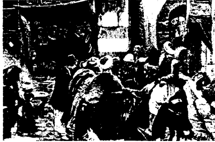
Şam'da bir pazar yeri

15. yüzyıldan sonra "ozan"ın yerini "âşık", kopuzun yerini "karadüzen, bağlama, çöğür, tambura, cura vb." almıştır (Köprülü,1989: 57). 15. yüzyıla gelinceye kadar