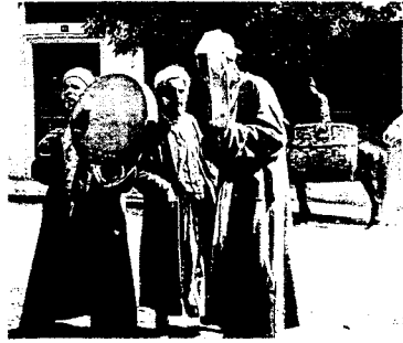
Batılı ressamlar gözüyle İstanbul, "Seyyar Çalgıcılar". (Elsa Zonaro, 1864-1945)

16. yüzyılda aşk, kahramanlık, tabiat vd. konuların yanı sıra yerleşik hayata ait özellikler de tablolar halinde âşık edebiyatına girmeye başlamıştır. Âşık edebiyatı Osmanlı toplumunun Anadolu'daki köklü kültür ve yapı değişikliğine uğraması sonucu oluşmuştur. Büyük şehirlerin çevresinde oluşan üst kültür mimaride, müzikte, edebiyatta yeni bir bakış açısı, yeni bir yaşama biçimi, yeni bir zevk oluşturmuştur. Anadolu'da köy ve konar göçer çevrelerde İslâmî kültür etkisiyle Orta Asya Türk kültüründen farklı, fakat büyük şehirlerin etrafında oluşan üst kültürü de yakalayamayan bir kültür oluşmuştur. Âşık şiiri ile divan şiiri aynı kültür kaynaklarından beslenmelerine rağmen kültür ve şiir çevresi farklılığından dolayı iki ayrı disiplini ortaya çıkmıştır. Divan şiirinin üst kültürün beslediği şiir olarak büyük şehir ve kültür merkezlerinin dışında kasabalarda üst kültürü