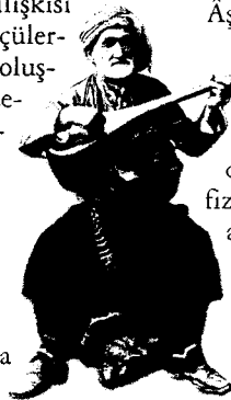
İstanbul'da bir ozan

Âşıklar, "Âşıklara Methiye, Âşıklar Destanı, Âşıklar Serencâmı, Âşıkname. Ozanlar, Ozanlar Şiiri, Tekerleme, Şairler Destanı, Şairname" gibi adlarla anılan şairnameler, di- van şairlerinden bahseden Şuarâ Tezkipleri kadar olmasa da âşıkların memleketi, adı, tarikatı, fiziki ve ruhi yapısı gibi niteliklerini yansıtmaları, asıl önemlisi de bir âşığın başka âşık tarafından değerlendirilmesi bakımından önem kazanırlar. Sözü edilen âşığa ait ipuçları bir araya getirildiğinde, o âşık hakkında yeni bilgiler elde edilebilir. Ayrıca, hangi âşıkların kendisinden sonraki âşıklarca tanındığını ve şöhret bulduğunu, hangi niteliklere sahip olduğunu bu eserlerde