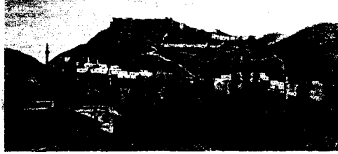
Bayburt, genel görünüm

Yeni bir estetik ve doğrudan doğruya yaşamdan alınan yeni konular, yaşam ve gerçeğe beslenemeyen, soyut düşüncelere dayalı düşüncelerle içine kapanmış divan şiirini sarstı. Tanzimat'la birlikte yeni edebiyatın yapısında kullanılacak değer ve kavramlar getirme çabası, günlük hayatla ilgili her türlü olay, duygu ve düşüncüyü şiirin ve nesrin konusu olarak seçen Tanzimat edebiyatını doğurdu. Önceleri biçimde eski, özde yeni şiir anlayışıyla başlayan Tanzimat edebiyatı, divan şiirinden aktarılmış değiştirilmiş öğelerle yeniliğe başlar. Divan şiirinin sebk-i Hîndî hayallerinden ve girift mazmunlarından sıyrılarak, şiirde yalın düşünce diye